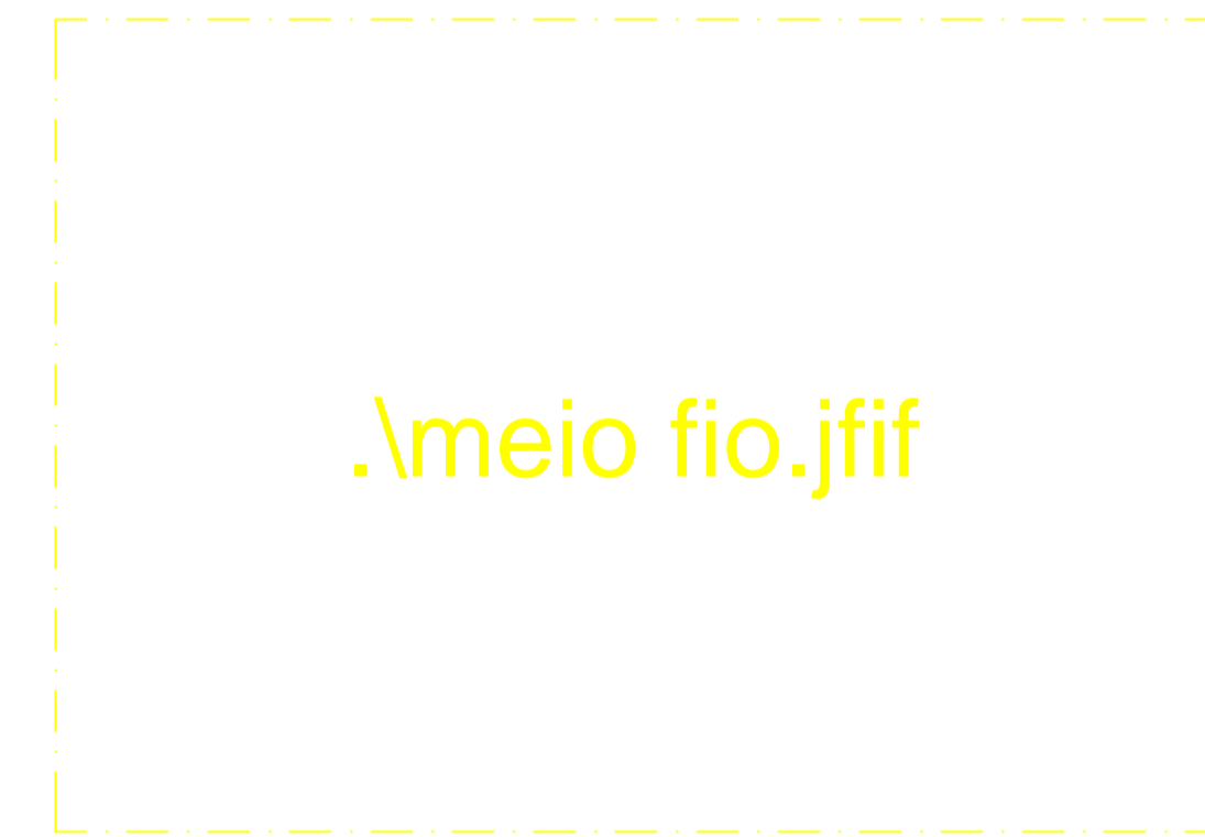
DETALHE - MEIO FIO ESTACIONAMENTO