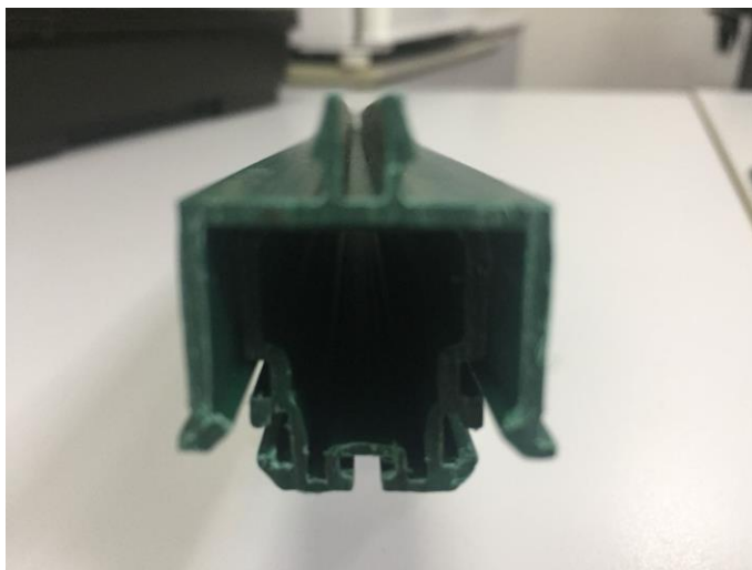
FIGURA 02: IMAGEM DE UM EXEMPLO DE PRODUTO ESPERADO