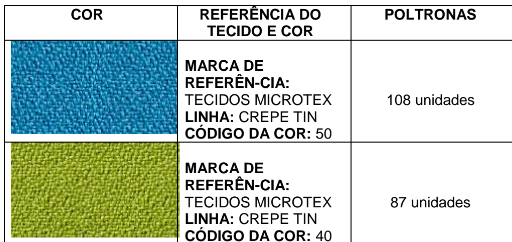
TABELA DE CORES E ACABAMENTO - QUADRO GERAL